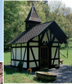
Mutter Rosa Gedenkstätte