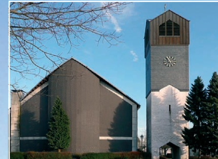
„Heilige Schutzengel“ Kirche Kurtscheid