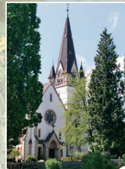
Evangelische Kirche Rengsdorf