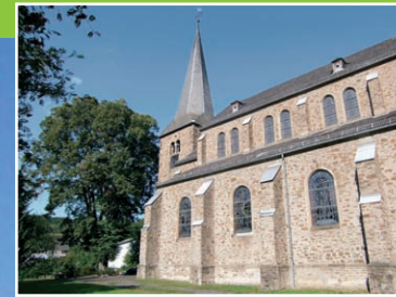
Pfarrkirche „Maria Himmelfahrt“ Waldbreitbach