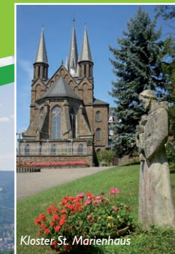
Kloster St. Marienhaus