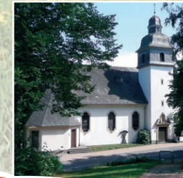
St. Kastor-Kapelle Rengsdorf